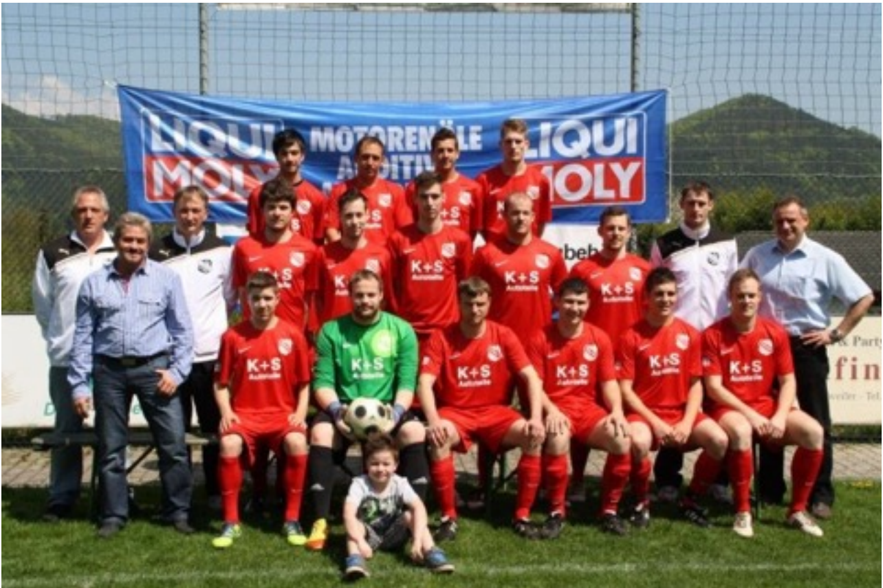
1. Mannschaft des TuS Erfweiler Saison 2012/ 2013, mit neuem Trikotsponsor K&S und Liqui Moly.